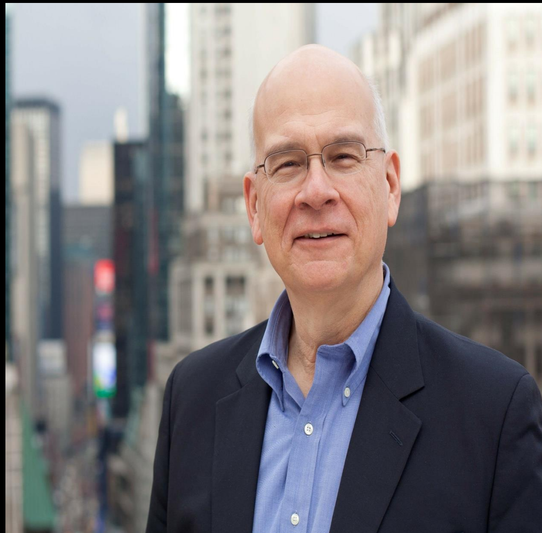
Timothy Keller (1950 –2023)