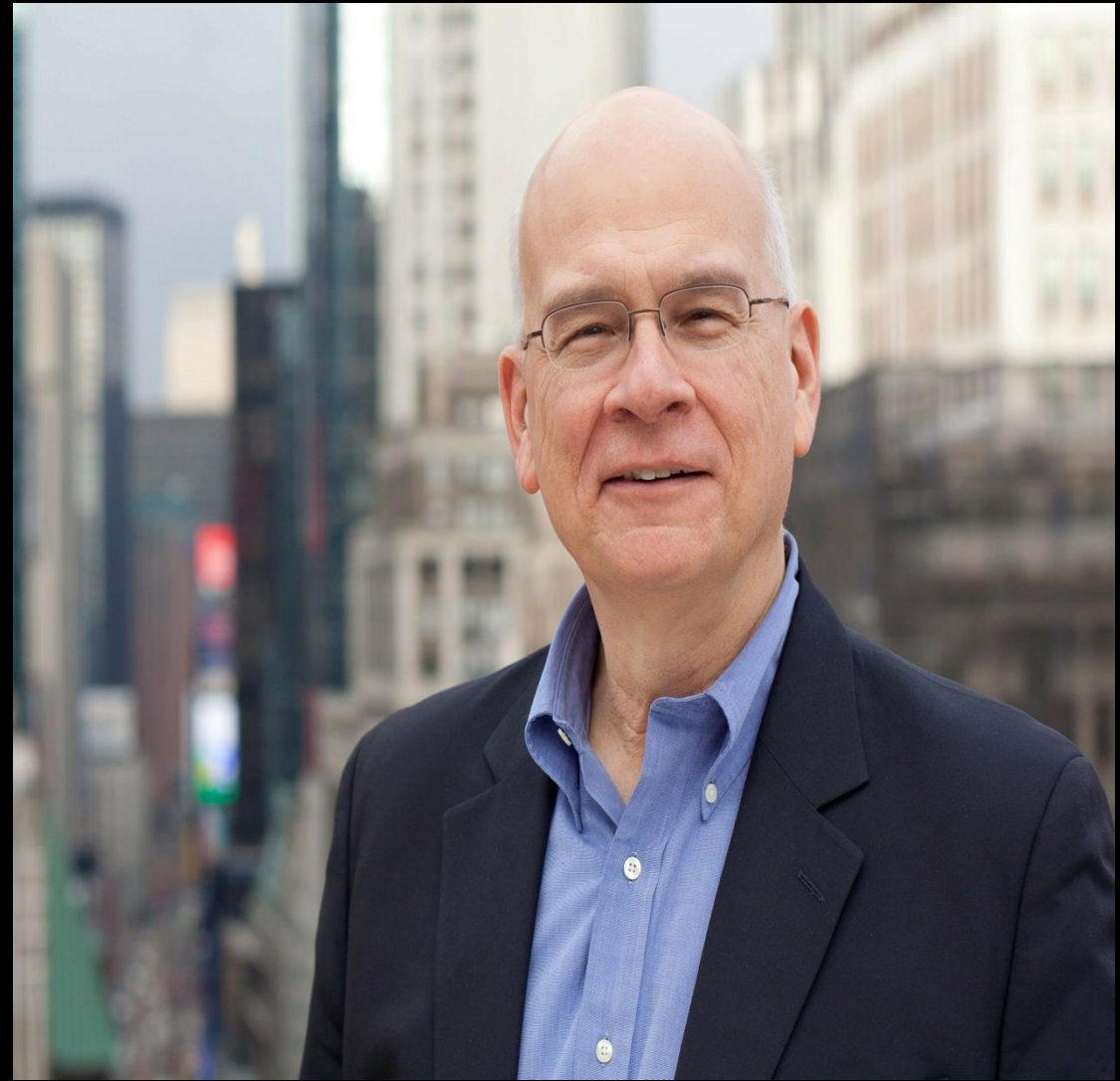
Timothy Keller (1950 –2023)

「順服不是你同意丈夫的每一個決定，而是你願意在彼此有分歧、且不涉及罪的情況下，仍然願意放下自己的執著，讓他來承擔最終的責任，帶領家庭前進。」