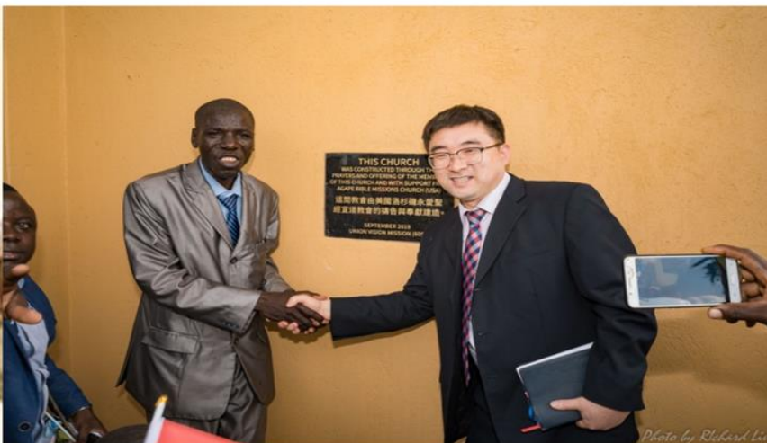
第 605 間教堂