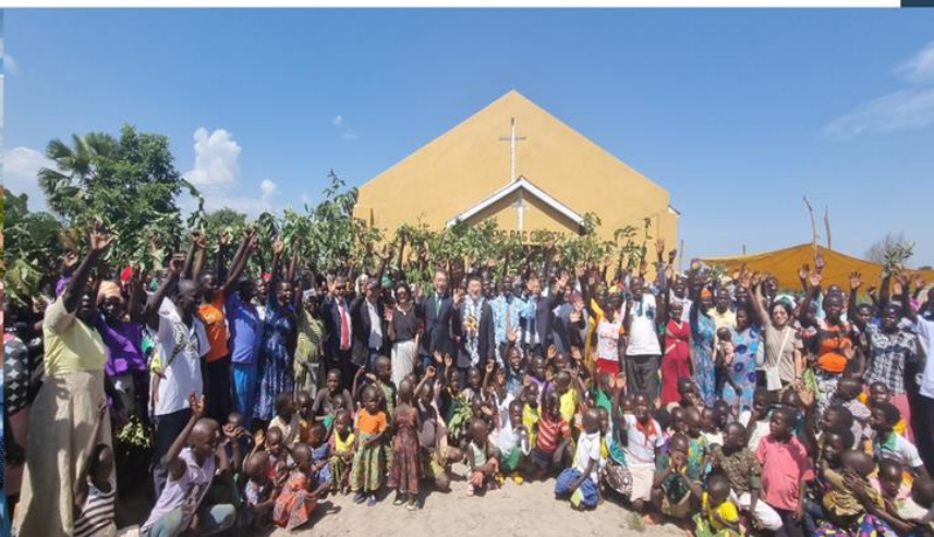
第 1818 間教堂