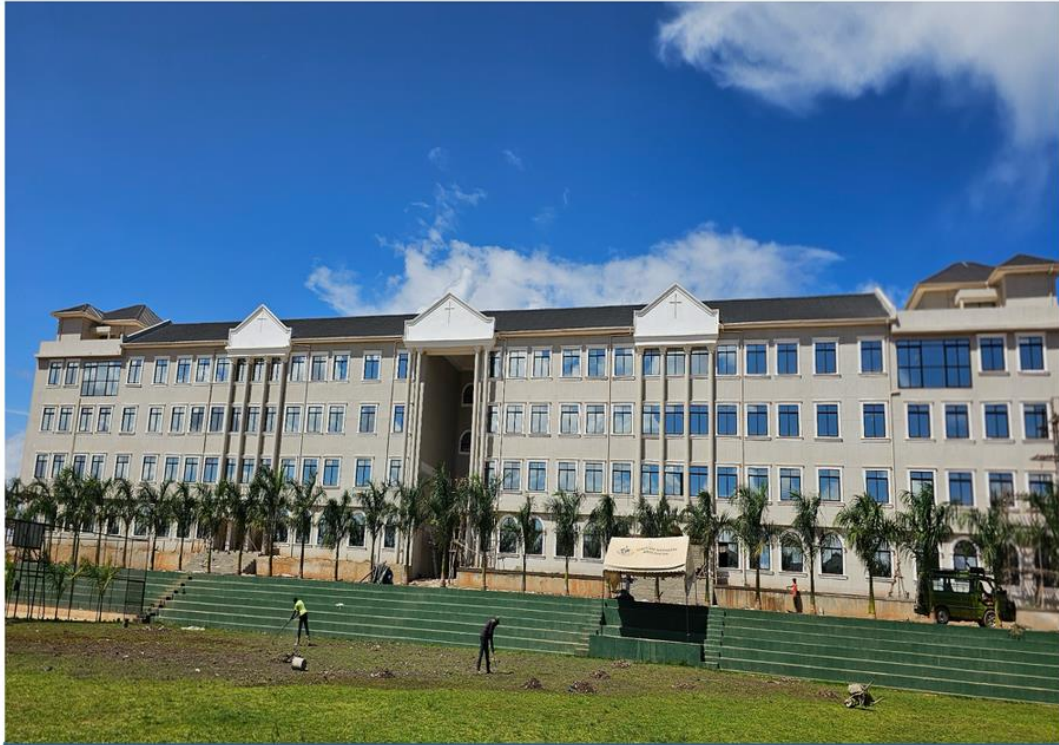
培養當地領袖和宣教士