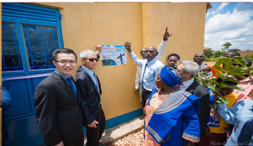
第 606 間教堂